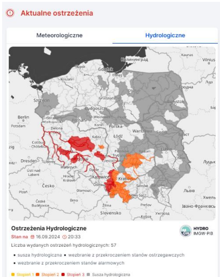
Ryc. 3. Obszar aktualnie wydanych ostrzeżeń hydrologicznych. https://meteo.imgw.pl/dyn/#oshyd=true