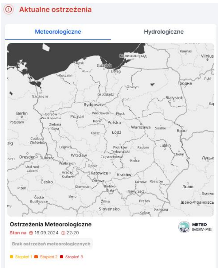
Ryc. 4. Obszar aktualnie wydanych ostrzeżeń meteorologicznych. https://meteo.imgw.pl/dyn/#osmet=true